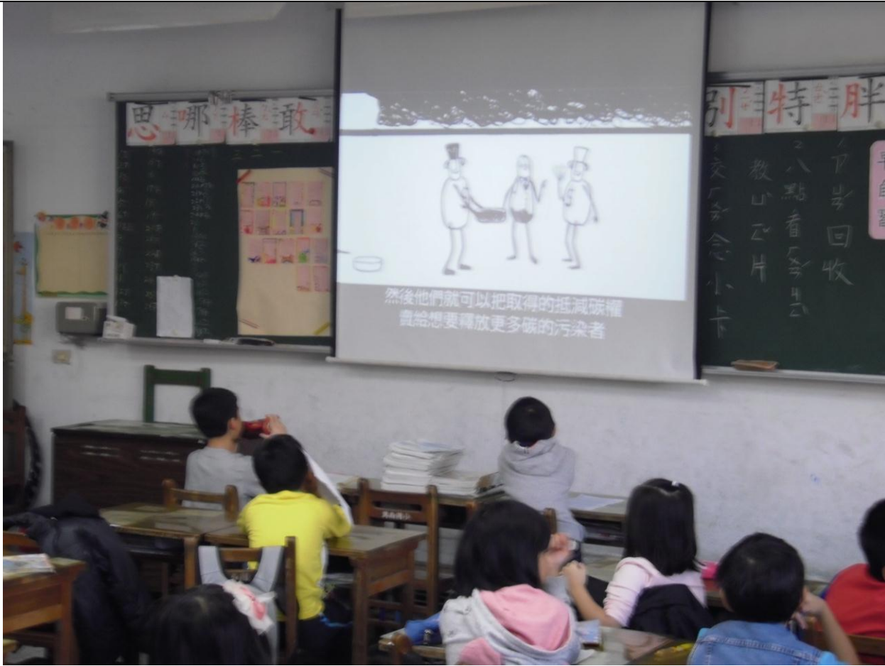
學生專心觀看影片