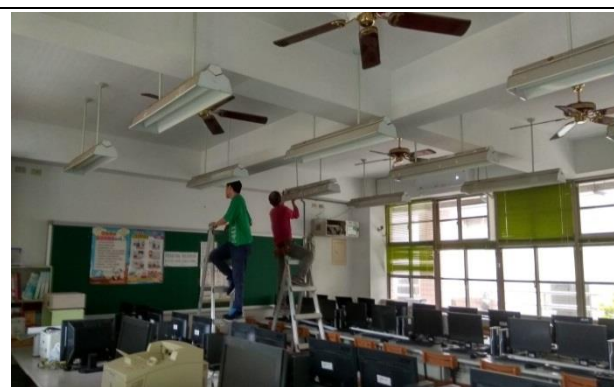
節能廠商開始到校施工—電腦教室