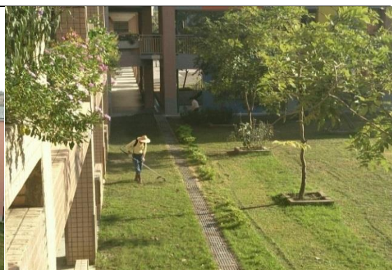
學校營造綠化活動中庭空間