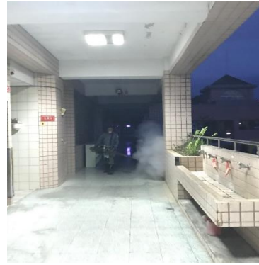
進行預防性校園室內外噴撒消毒。