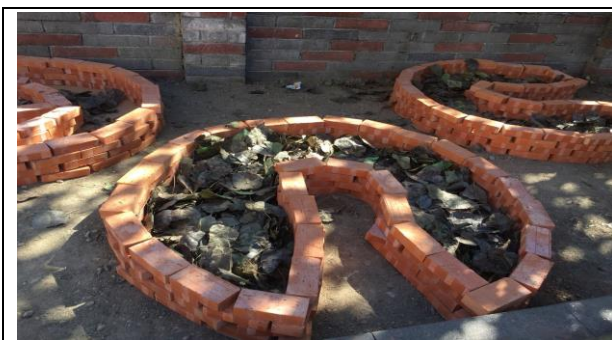
利用校園樹木落葉，進行堆肥。