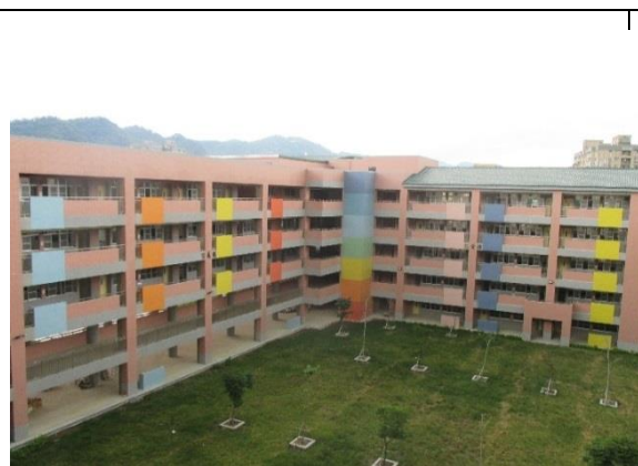
學校營造綠化活動中庭空間