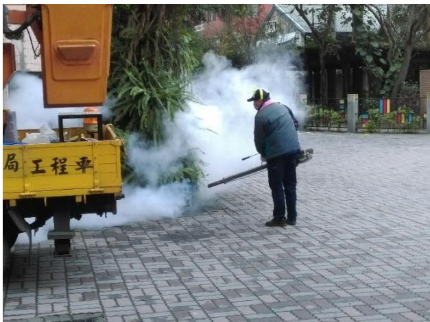
委請新北市環保局進行校園消毒活動