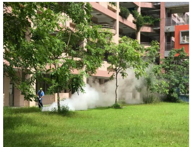
委請新北市環保局進行校園消毒活動