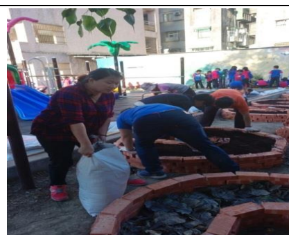
利用校園樹木落葉，進行堆肥。