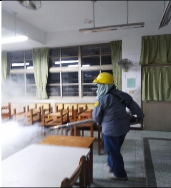
進行預防性校園室內外噴撒消毒。

◎校園消毒:定期與環保局清潔隊聯繫，進行校園室外消毒，撲滅病媒蚊；並依需求進行室內外加強噴消。