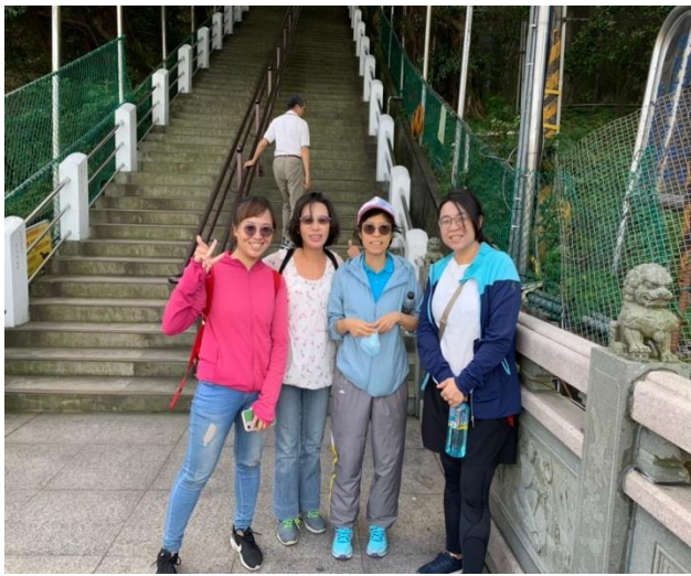
109. 11. 25 烘爐地教師環境生態研習

2. 結合學校特色辦理師生環教增能研習，如節約能資源、綠色消費、生態相關、環保相關、風土與人文文化保存類之軟硬體之實質作為。