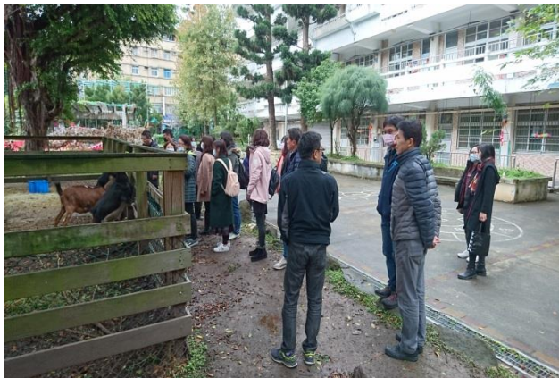
秀山國小環境教育教師增能研習