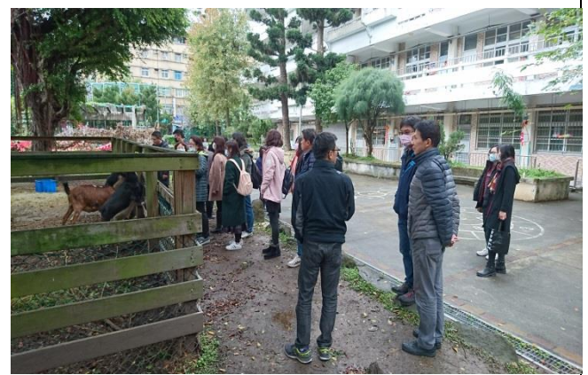
秀山國小環境教育教師增能研習